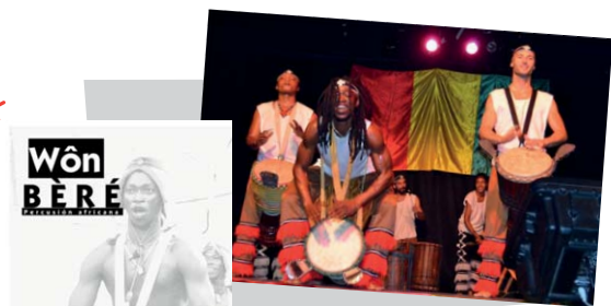
grupo Wôn Beré

20:00 h. Espectáculo de música y danza guineana en directo a cargo del grupo Wôn Beré. Se finalizará la actuación con un taller de danza y música para los asistentes.